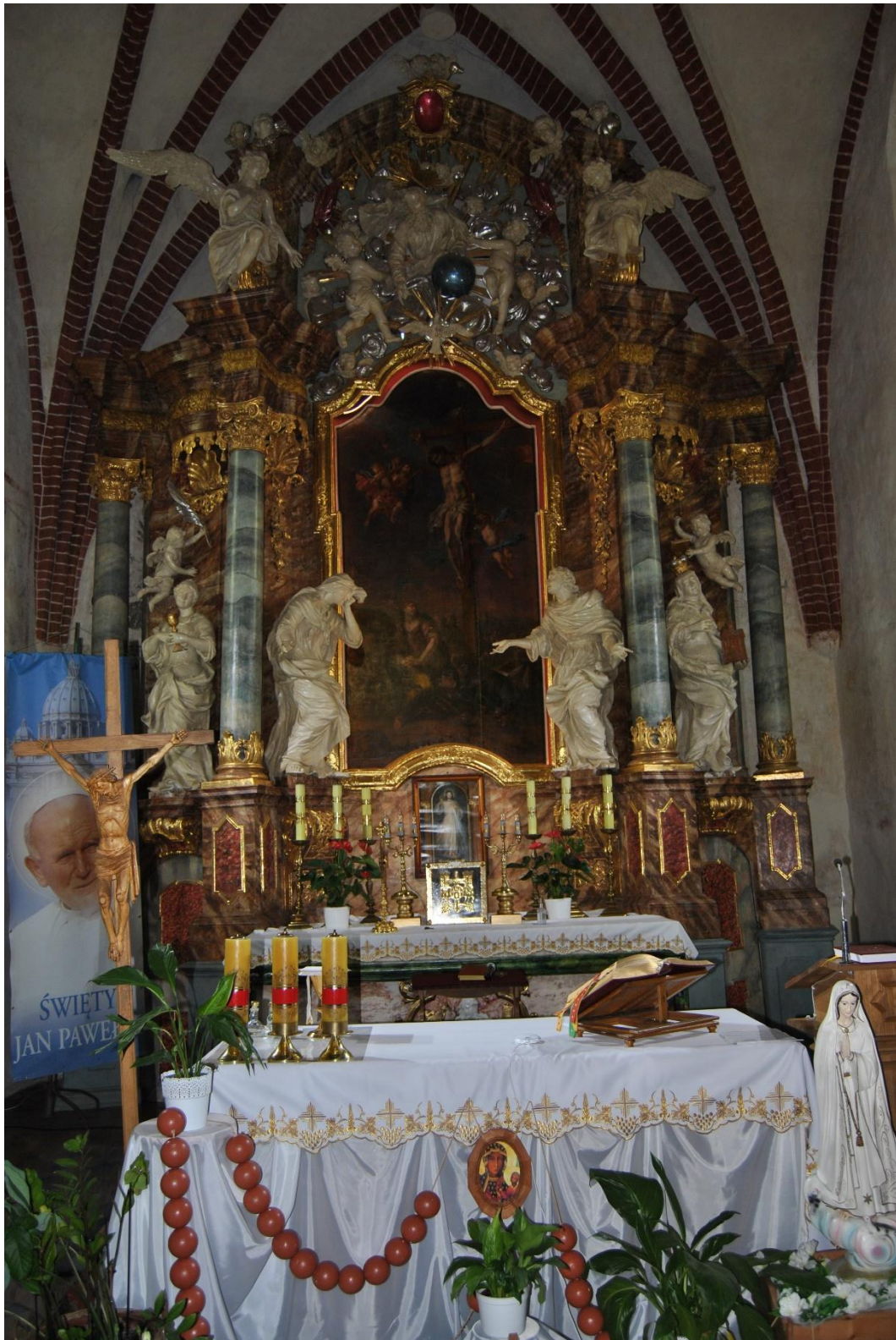
Fot. 1. Nowe Miasteczko, Kościół pw. Św. Marii Magdaleny, prezbiterium oltarz główny. Stan po konserwacji etap I i II, przed pracami etapu III. Widoczna warstwa marmoryzacji odslonięta ale bez konserwacji technicznej i estetycznej.