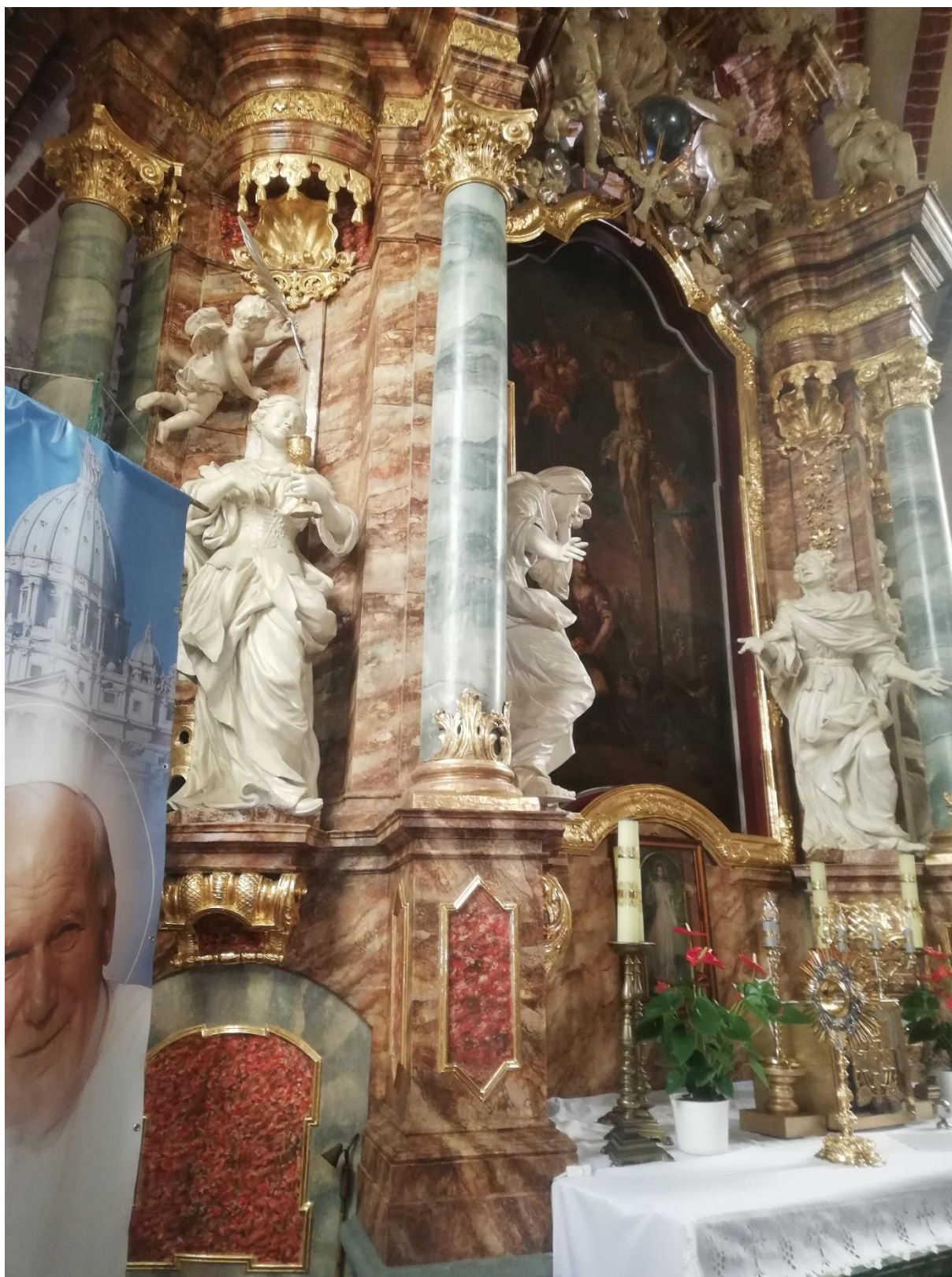
Fot. 5. Nowe Miasteczko, Kościół pw. Św. Marii Magdaleny, prezbiterium ołtarz główny. Stan po konserwacji etap I i II, przed pracami etapu III. Widoczna warstwa marmoryzacji odsłonięta ale bez konserwacji technicznej i estetycznej. Widoczne zarysowania, ubytki w partii predelli i wtórna kolorystyka w płycinach predelli.