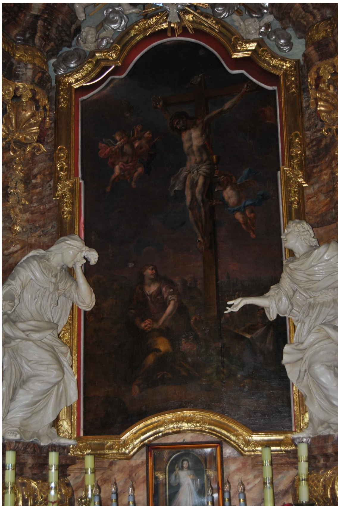
Fot. 3. Nowe Miasteczko, Kościół pw. Św. Marii Magdaleny, prezbiterium ołtarz główny, fragment. Obraz Ukrzyżowanie z Marią Magdaleną. Stan po konserwacji etap I i II, przed pracami etapu III. Widoczne zmiany kolorystyczne w licu obrazu – pociemnienie i przyżółcenie werniksu.