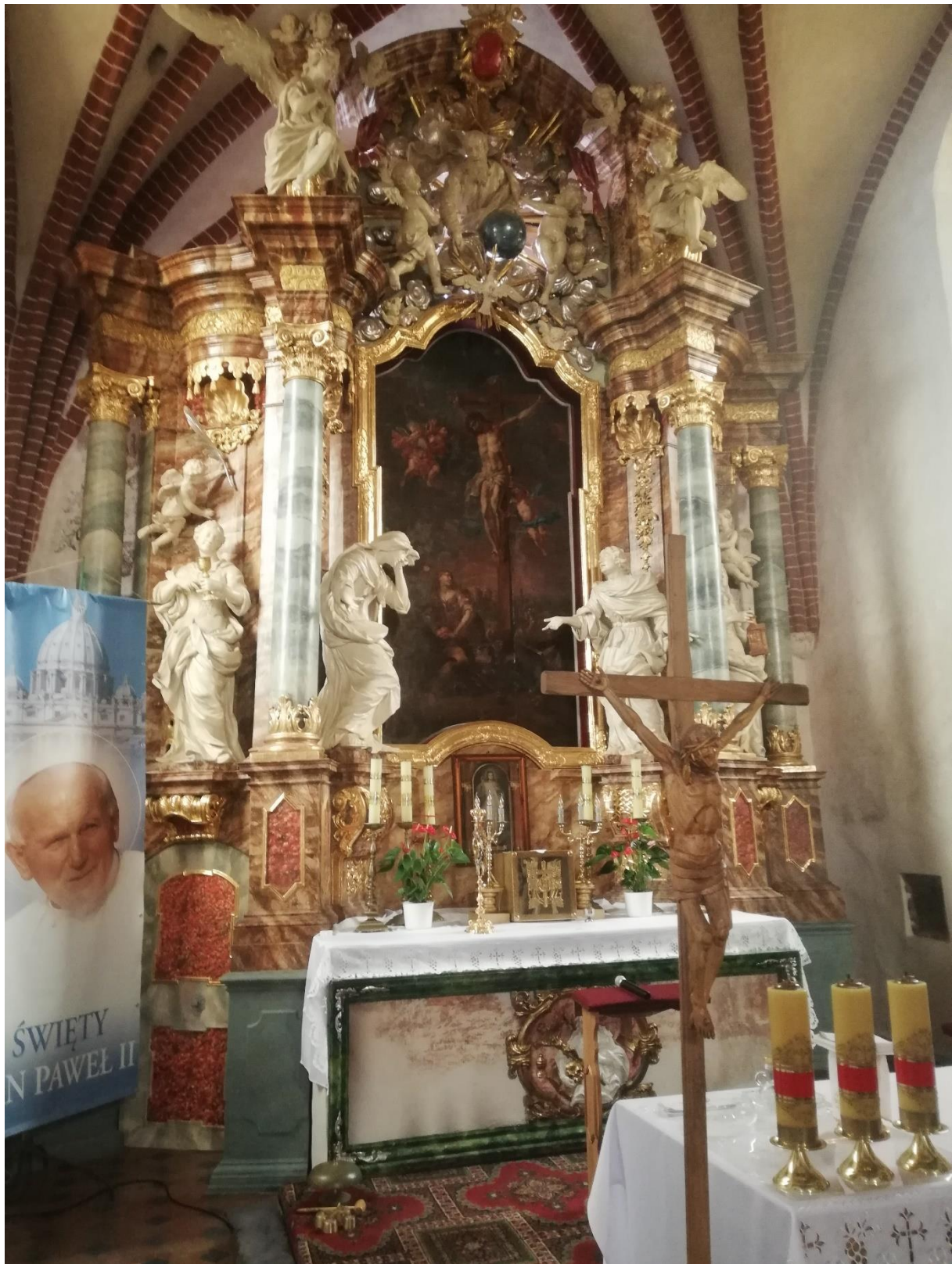
Fot. 6. Nowe Miasteczko, Kościół pw. Św. Marii Magdaleny, prezbiterium ołtarz główny. Stan po konserwacji etap I i II, przed pracami etapu III. Widoczna warstwa marmoryzacji odsłonięta ale bez konserwacji technicznej i estetycznej. Widoczne wtórne rozwiązania kolorystyczne i ubytki snycerki w antepedium.