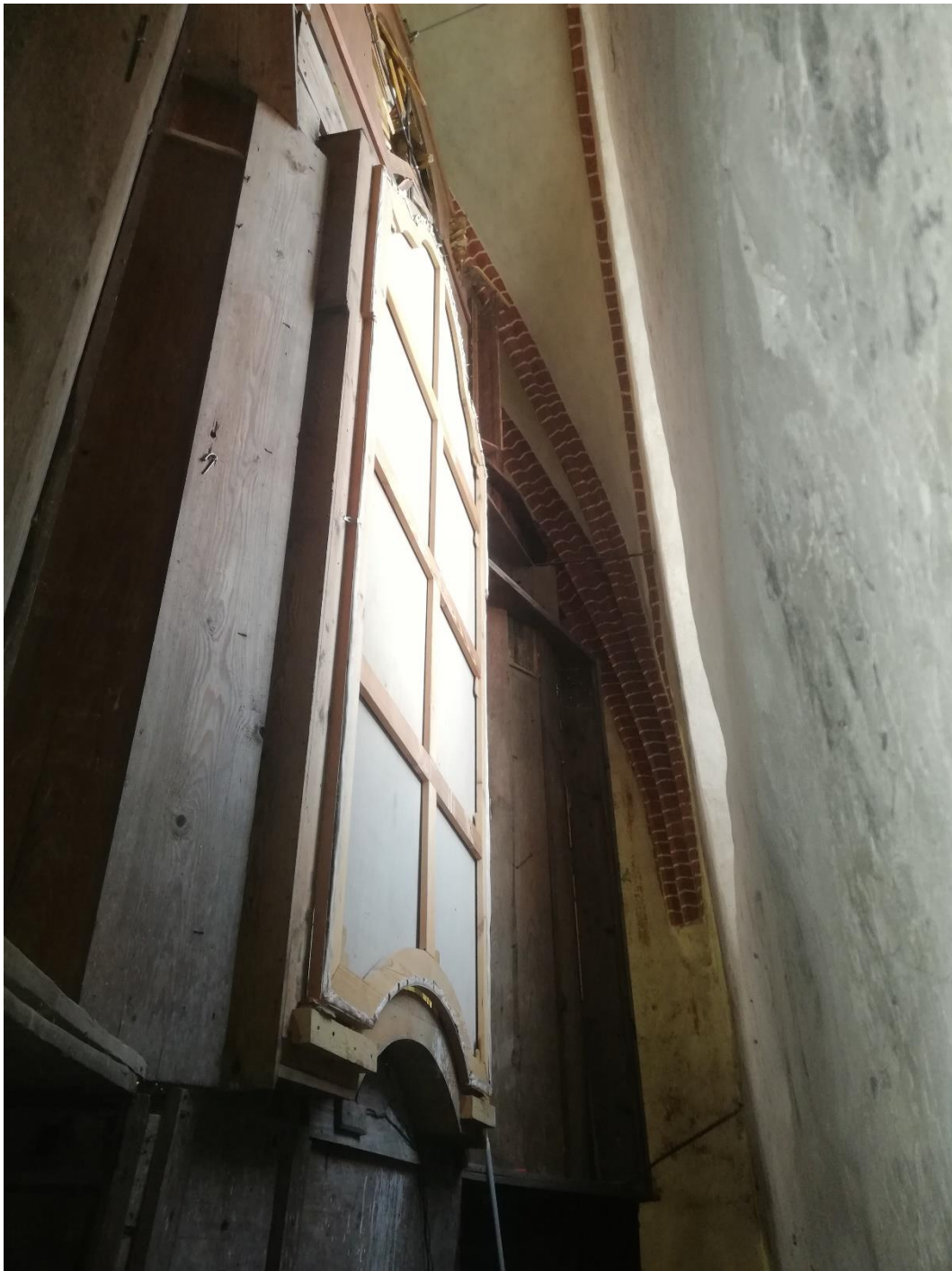
Fot. 4. Nowe Miasteczko, Kościół pw. Św. Marii Magdaleny, prezbiterium ołtarz główny, fragment. Obraz Ukrzyżowanie z Marią Magdaleną. Stan po konserwacji etap I i II, przed pracami etapu III. Widoczne odwrocie obrazu z nowymi krosnami i płótnem dublującym.