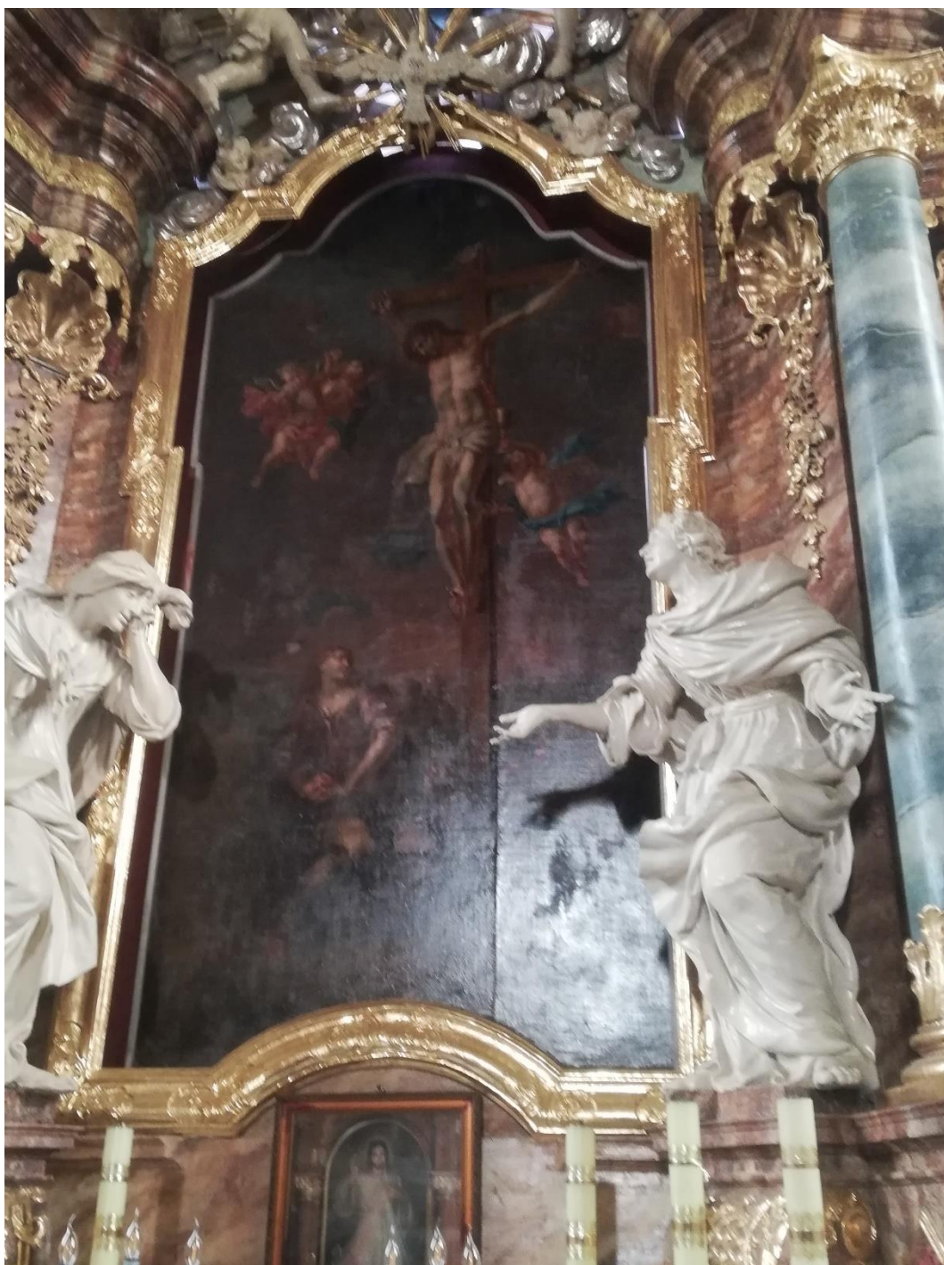
Fot. 2. Nowe Miasteczko, Kościół pw. Św. Marii Magdaleny, prezbiterium ołtarz główny, fragment. Obraz Ukrzyżowanie z Marią Magdaleną. Stan po konserwacji etap I i II, przed pracami etapu III. Widoczne zmiany w licu obrazu, deformacje płótna, szew i nierówne rozłożenie werniksów na licu.