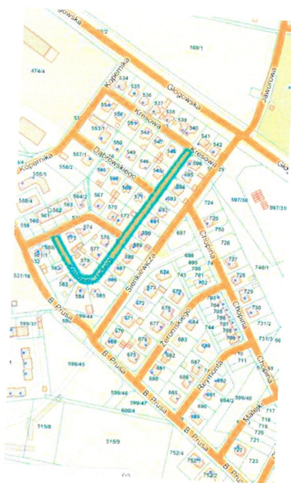
Przebieg drogi gminnej nr 102542F