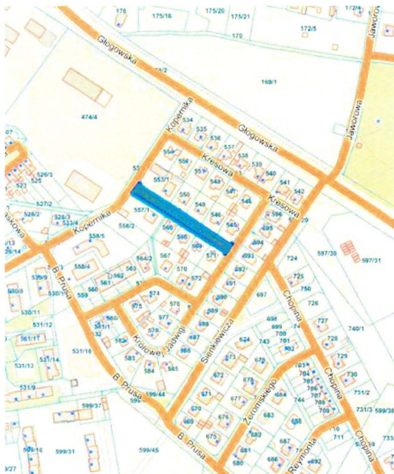
Przebieg drogi gminnej nr 102539F