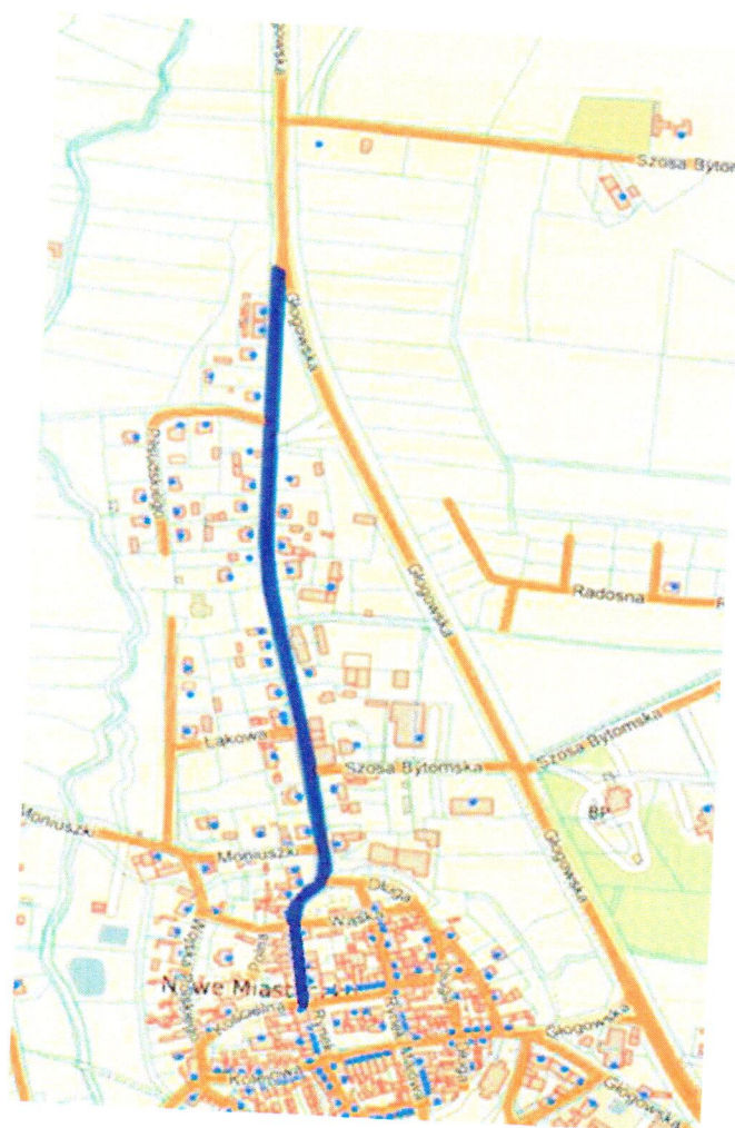
Przebieg drogi gminnej nr 102534F