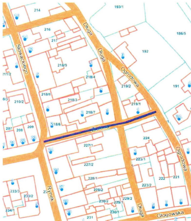
Przebieg drogi gminnej nr 102522F