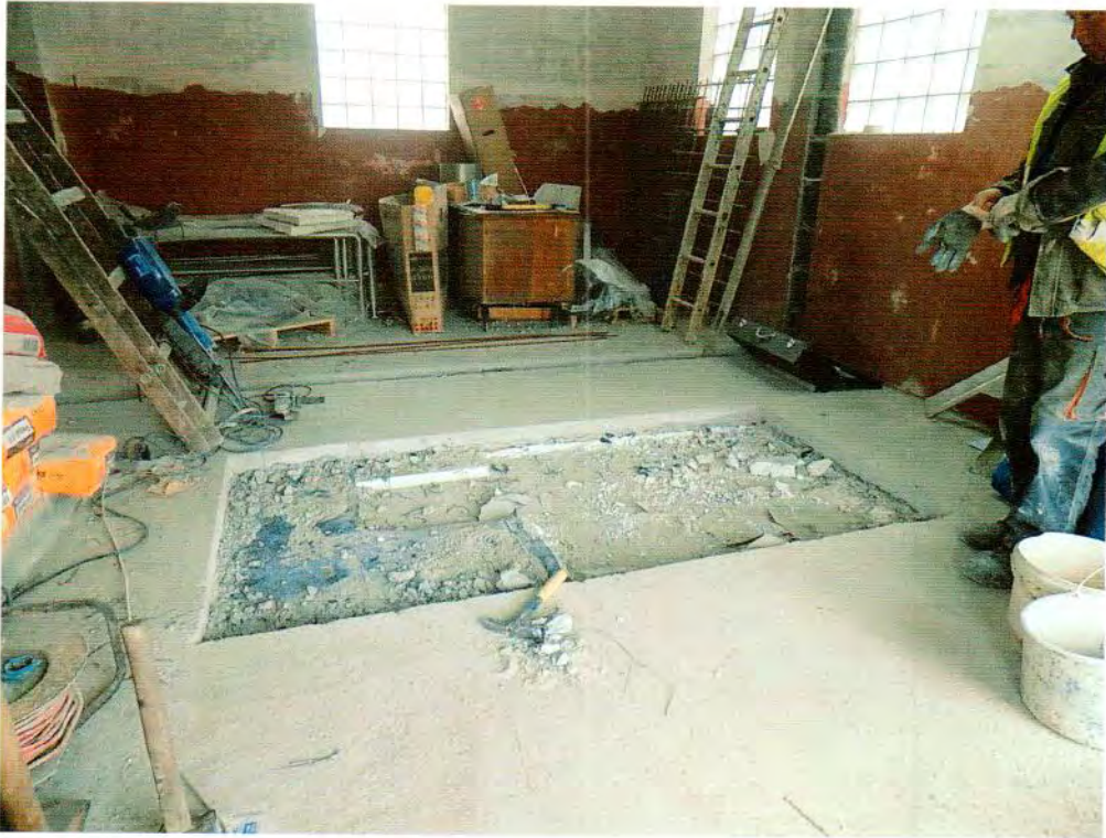
Zdjęcia z 25.04.2019 r.